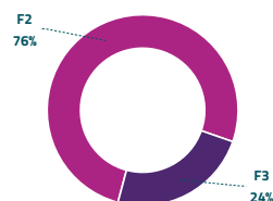
Grafico 2: ripartizione per fascia