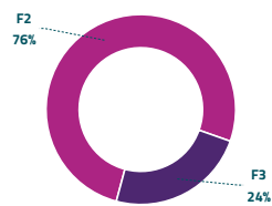
Grafico 2: ripartizione per fascia