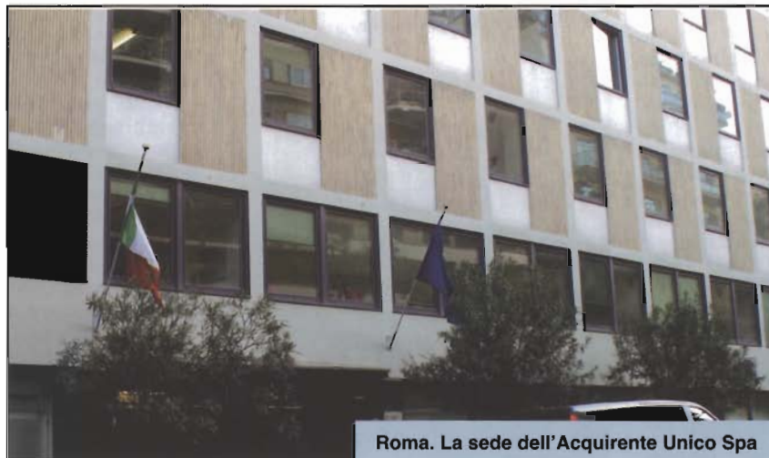
Roma. La sede dell'Acquirente Unico Spa

Relativamente alle dimensioni del mercato servito da quest'ultimo, alla fine di aprile 2009 esso comprendeva poco meno di 32 milioni di utenti, di cui più di 26,5 milioni di famiglie e