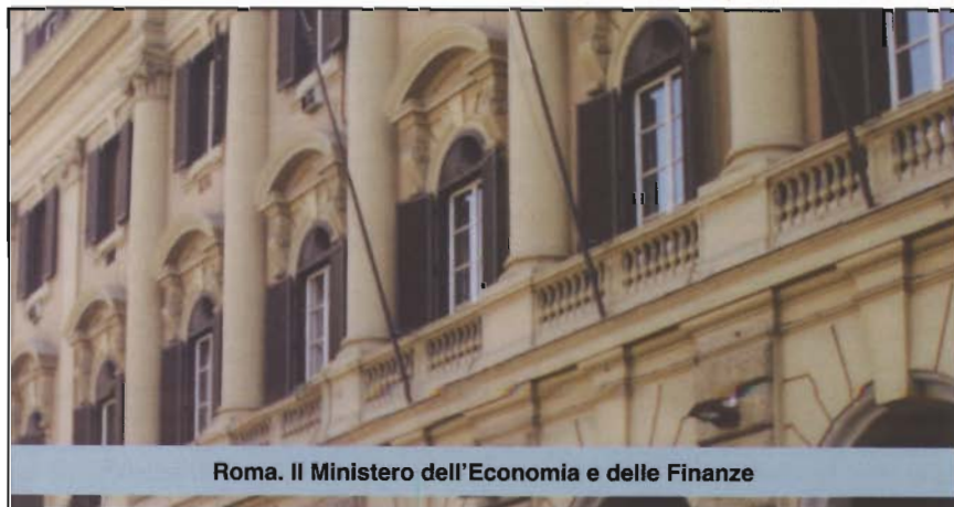
Roma. Il Ministero dell'Economia e delle Finanze

Va sottolineato che la voce della bolletta elettrica che dipende interamente dall'attività di Acquirente Unico, è la «componente energia», la più rilevante nella formazione della bolletta stessa, rappresentando per una famiglia tipo, con consumi medi di 2.700 kWh/anno e una potenza impegnata di 3 kW, quasi il 64 per cento della spesa totale lorda. Le altre voci della bolletta sono relative alla copertura dei costi di trasmissione, distribuzione e misura, per circa il 15 per cento, le imposte (Iva, imposte erariali e locali) per il 14 per cento e gli oneri di sistema (cioè i costi che coprono gli oneri a carico della generalità dell'utenza elettrica) per circa il 7 per cento. Ciò conferma, la delicatezza e la strategicità del ruolo che svolge Acquirente Unico nel sistema elettrico italiano.